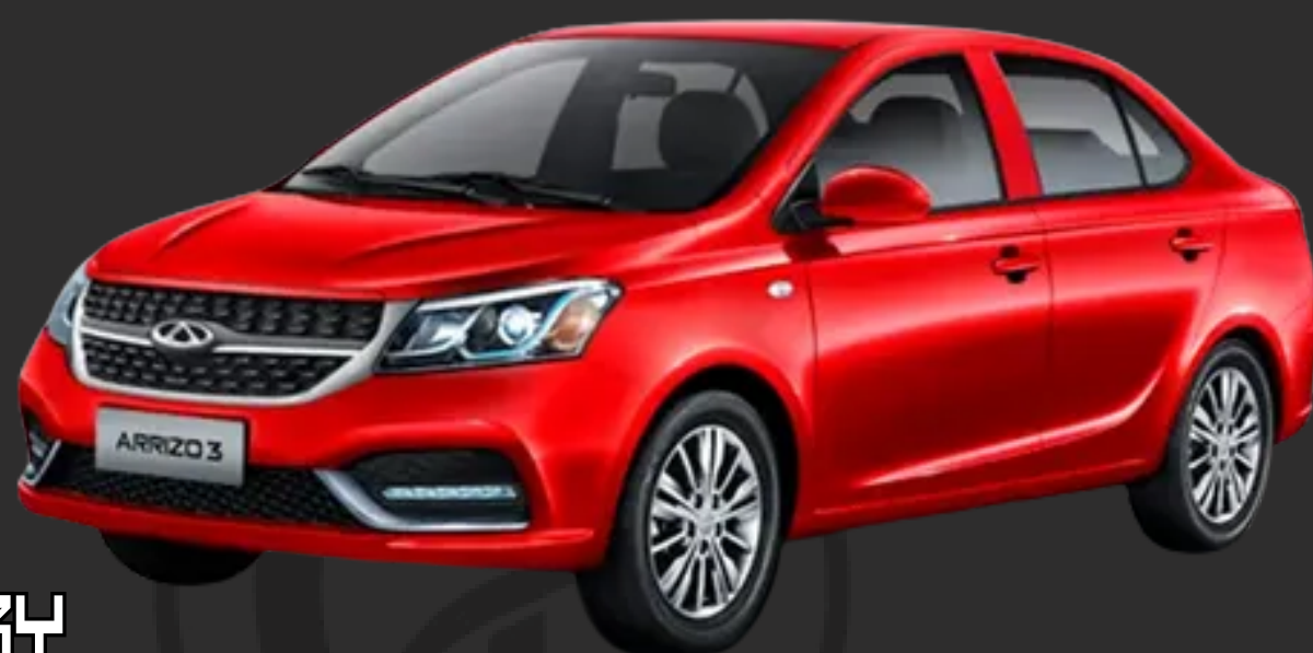
CHERY ARRIZO 3

I&C Asociados soluciones inmobiliarias y jurídicas