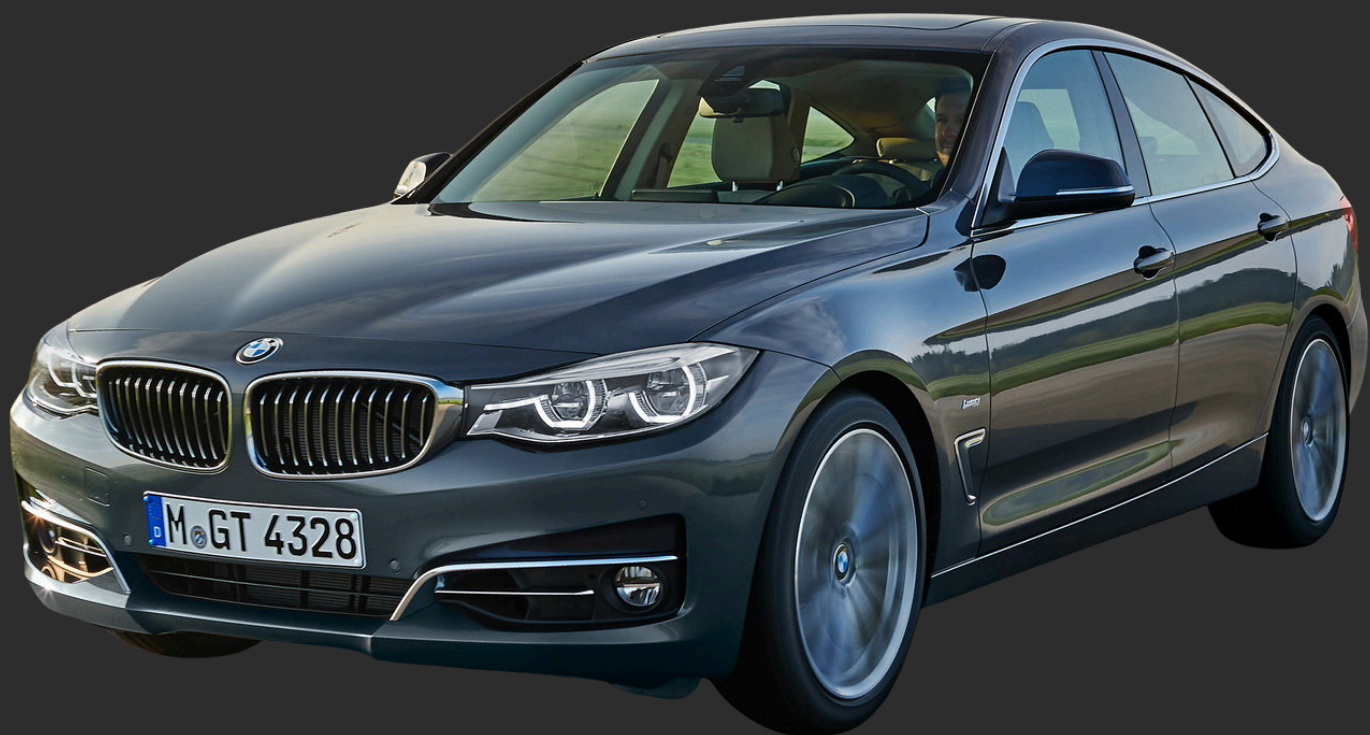
BMW SERIE 3